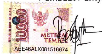
(Rahmat Akbar Muzata)